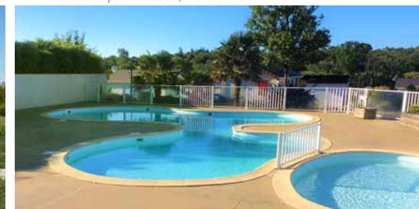
La piscine du Domaine