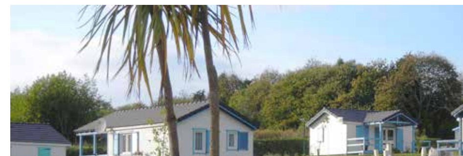
Au cœur d'un parc boisé de 3,5 hectares

Sur la RD44 en direction de Combrit, le hameau de Kerseorc'h offre un cadre verdoyant et arboré aux cottages du Parc Résidentiel. Ces bois abritent un remarquable châtaignier millénaire, le monument végétal le plus célèbre de Bretagne et très certainement l'un des plus vieux arbres de France.