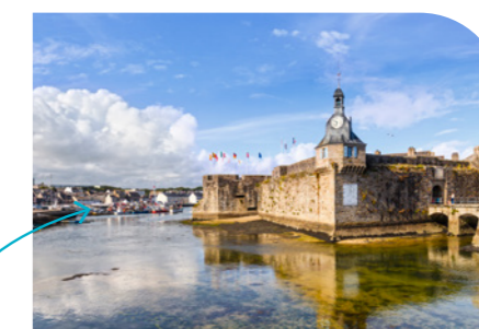
Découvrir le patrimoine à Concarneau 12km – 19 min en voiture