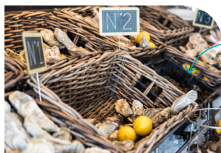
Assister au retour des pêcheurs à Bénodet 20km – 20 min en voiture