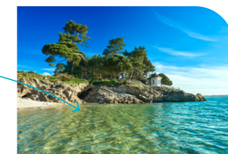
Prendre le large 18km – 25 min en voiture