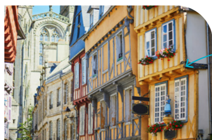
Flâner dans la cité de Quimper 15km – 15 min en voiture

Les villes historiques telles que Quimper, Concarneau et Pont-Aven sont des destinations incontournables pour découvrir la culture et l'histoire bretonne.