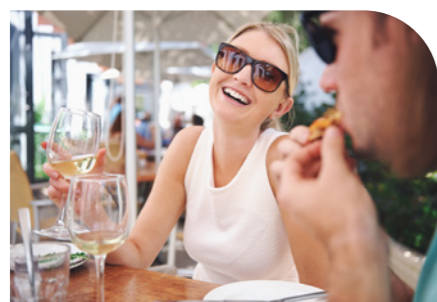
Faire une pause gourmande à Fouesnant 13km – 18 min en voiture