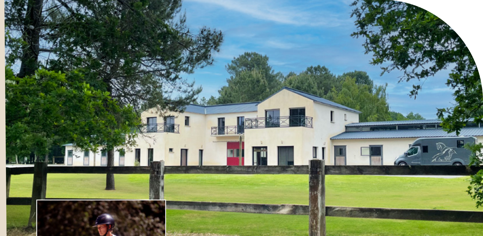
Écuries et espaces communs

Ce Domaine Résidentiel de Loisirs est accessible toute l'année. Vous pouvez résider ou louer votre habitat comme bon vous semble... en toute liberté.